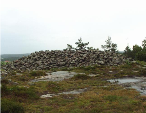
Røse, bronzealder, nær Vitlycke, Tanum Sogn.

Senere, fra bronzealderen, kendes i Bohuslän mange røser, d.v.s. gravhøje bygget af sten. Som vore egne bronzealdergravhøje kan også røserne betegnes som markante gravmonumenter. På højdedraget over helleristningsfeltet ved Vitlycke ligger der to store røser med vid udsigt udover det omgivende landskab. På denne tid befandt Bohuslän sig ikke mere nær grænsen for agrarsamfundenes udbredelse. Nu var grænsen flyttet op til omkring Polarcirklen. Men det er en anden historie, som vi vil berette om ved en anden lejlighed.