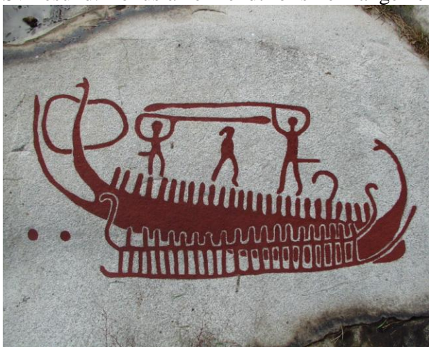
Helleristning med skibe, Massleberg,

Bohuslän er det kystnære landskab, der strækker sig fra Göteborg op til den norske grænse ved Svinesund. Bohuslän er kendt for sine mange helleristninger fra bronzealderen.