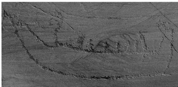
Skibsbillede af nordisk bronzealdertype fra helleristningsfelt ved Hjemmeluft, Alta, Finmark, Nordnorge. Ca. 700 f.Kr.

Ekspansionen af landbrugserhvervet var ikke én lang sammenhængende proces. Den første ekspansion i Norden standsede i de vestlige dele af Skandinavien i Sydøstnorge, d.v.s. i Østfold og Vestfold på hver side af Oslofjorden. Denne grænsezone holdt sig i næsten 2000 år, før det næste ’spring’ fandt sted, i slutningen af stenalderen og den ældre bronzealder, omkring og efter 2000 f.Kr. Den fornyede ekspansion for landbrug og husdyrbrug nåede helt op til omkring Polarcirklen, hvor vi finder både gravfund og offerfund knyttet til landskaber, hvor der i dag er landbrug. Noget tyder endda på, at den nordiske bronzealderkultur rakte helt op til de højeste nord; for ved Alta i Finmark er der blandt jægerkulturens helleristninger fundet nogle skibsbilleder, der i form og stil nøje svarer til skibsbilleder indhugget i klipperne nede i Sydskandinavien.