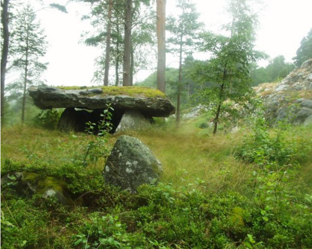
Dysse, Flat, Lyse Sogn.

Sydligst på vor dysse-jættestue-rejse skal vi se på et par grave i nærheden af Lysekil. I en åben skov ved Flat nær Torgestad ligger en velbevaret dysse, hvor dækstenen er overgroet med mos.