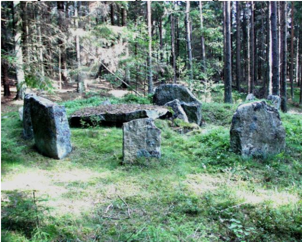
Dysse, Påls Hus, Nasseröd, Svenneby Sogn.

Når vi bevæger os nogle km mod syd fra Tanum, findes der i en skov ved Nasseröd en lille runddysse af den tidlige, enkle slags med et mindre, firkantet kammer. Den kaldes Påls Hus.