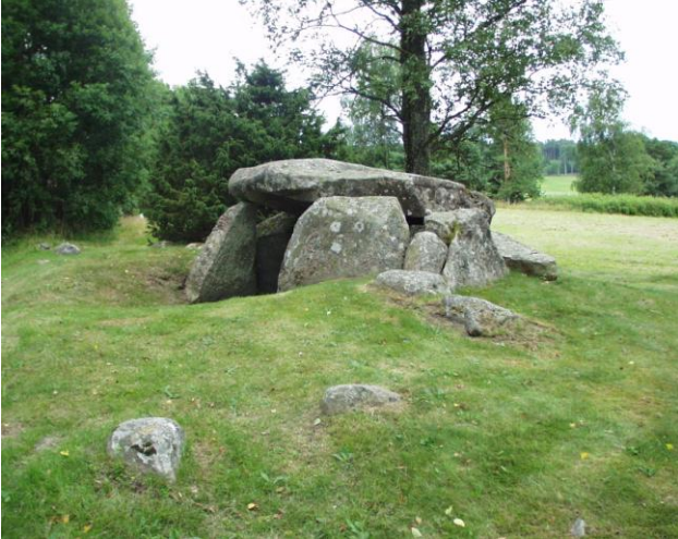
Jættestue, Massleberg, Skee Sogn.

bondestenalderens dysser og jættestuer. Så snart vi kommer syd for Svinesund, finder vi flere dysser og jættestuer, hvor jættestuen ved Massleberg ca. 15 km syd for grænsen kan fremhæves.