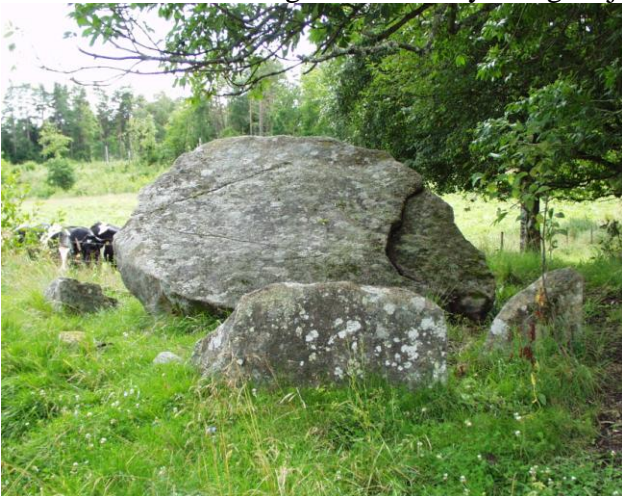
Dysse, nær Tanums Kyrka, Tanum Sogn.

En smuk dysse ligger tæt ved Tanums Kirke. Den har også en dæksten, som har lagt sig skråt. Dyssen ved Tanums Kirke har både gang og et stort kammer. Den kan betegnes som en stordysse, nærmest en mellemting mellem en dysse og en jættestue.