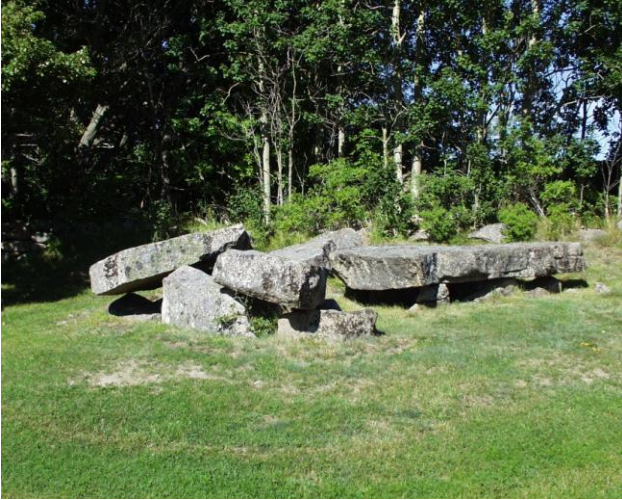
Jættestue, Hunnebostrand, Tossene Sogn.

I et hjørne af en stor kirkegård ved Hunnebostrand ligger en jættestue med en lang gang.