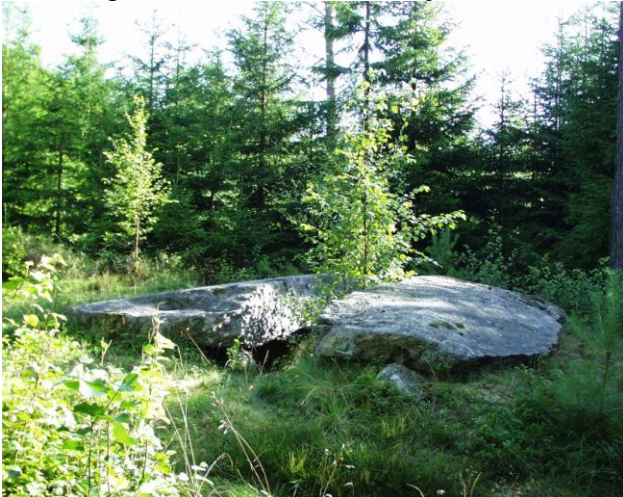
Jættestue, Nasseröd, Svenneby Sogn.

Ikke langt derfra findes en større jættestue med en stor flad dæksten, der er knækket i to.