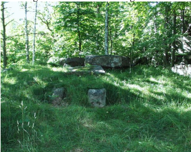
Jættestue, Glose Altare, Åby, Tossene Sogn.

Inde i en lille skov ved Åby i nærheden af dyreparken "Nordens Ark" kan man se jættestuen Glose Altare. Det lidt underlige navn kan stamme fra romantikken, hvor man mente, at dysser og jættestuer ikke var grave, men derimod hedenske offeraltre. Ordet Glose betyder på Bohuslänsk dialekt 'gammelt'. – Altså: "Det gamle Alter".