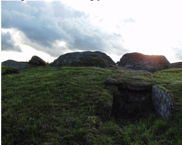
Jættestue, Karleby ved Fallköping, Västergötland

Men i ét område i indlandet, nemlig i det centrale Västergötland, ikke langt fra disse monumenters nordgrænse, findes en af Europas tætteste koncentrationer af jættestuer overhovedet. Inden for et område på kun 40 x 25 km omkring Fallköping kendes mere end 200 jættestuer. Her er der nogle af Sveriges bedste landbrugsjorder.