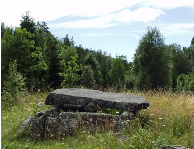
Hellekiste, senneolitikum, Valbrets Grav, Tanum.

Der findes i Bohuslän også monumental gravarkitektur, som er senere end dysser og jættestuer. Det drejer sig om hellekister fra stenalderens slutningstid, ca. 2000 f.Kr. Smukt beliggende i en lysning i en åben løvskov i nærheden af Tanumshede ligger hellekisten Valbrets Grav.