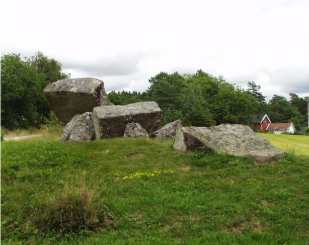
Jættestue, Snedstenan, Tanum Sogn.

Lidt sydligere i Bohuslän, tæt ved vejen mellem Tanumshede og Grebbestad ser man jættestuen Snedstenan – navnet henviser til, at de store dæksten er skredet ned og har lagt sig på skrå.