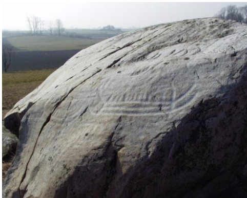
På dyssen fra Gladsax ses skibsbilleder fra bronzealderen.