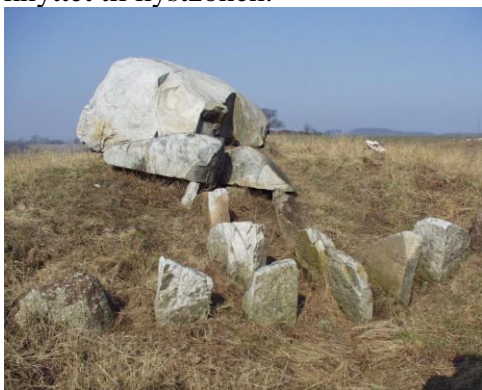
Dysse fra Gladsax, Österlen, Skåne.

Dysser og jættestuer findes i Skåne, Halland, Bohuslän og Västergötland. De er først og fremmest knyttet til kystzonen.