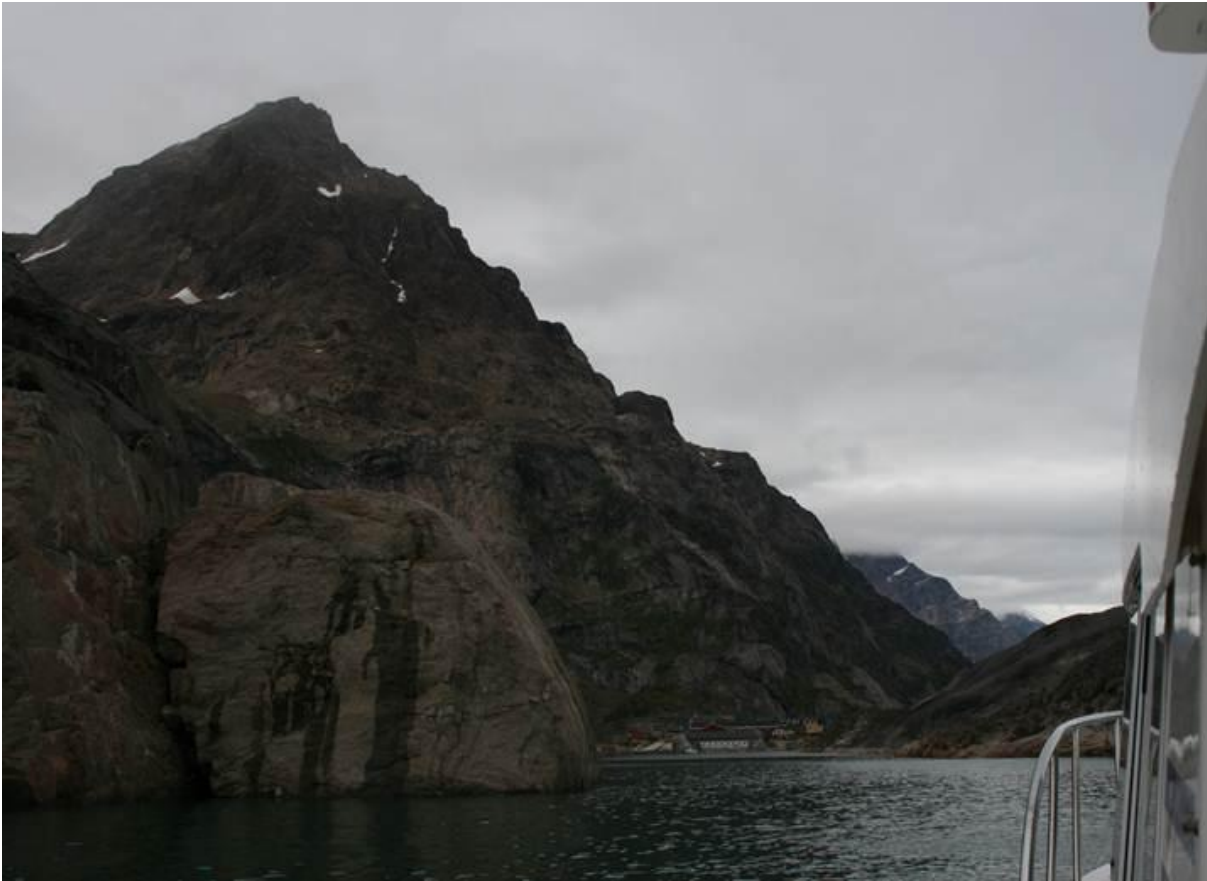
Indsejlingen til Aappilattoq.