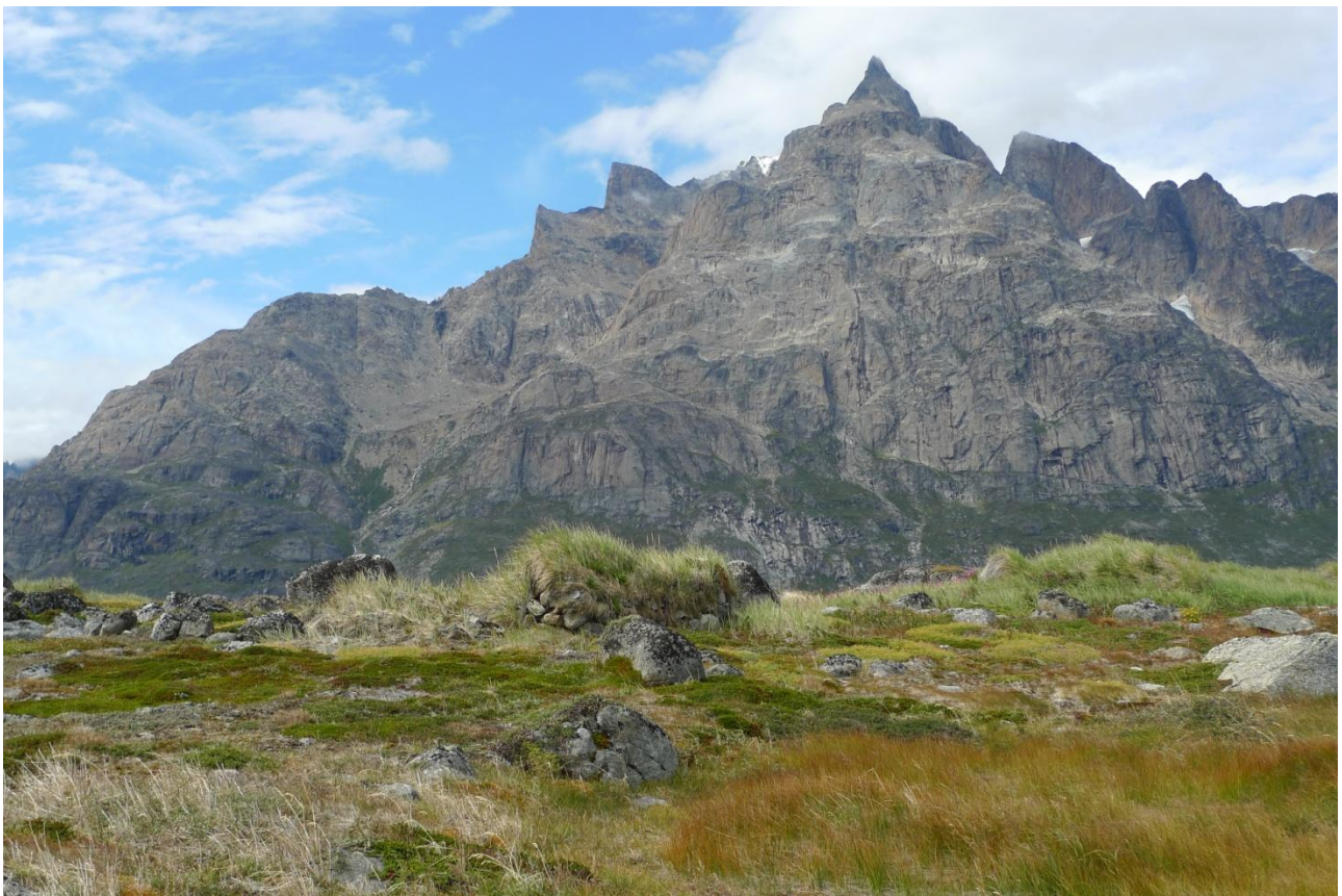
Hustomter ved Nuuk øst for Aappilattoq inderst i fjordsystemet Ilua. Bopladsen blev affolket i 1951.

De fleste gav udtryk for, at de ikke havde haft nogen særlig god skolegang. I skolen lærte børnene at læse efter ABD, og de havde også skrivning. Af andre fag var der religion, biologi, regning og nogle af dem havde haft geografi, mens ingen havde lært dansk. Meget af undervisningen bestod i at læse i Bibelen og i at lære udenad, og de havde ikke meget skolemateriale. Mange af lærerne var ikke uddannede kateketer, men læsere, dvs. fangere, der blot kunne læse og skrive, og undervisningen var kun en bibeskæftigelse, så fangsten var vigtigere end skolen. Læserne var nødt til selv at gå på fangst, og flere fortalte, at der derfor som regel ikke var nogen undervisning, når vejret var godt.